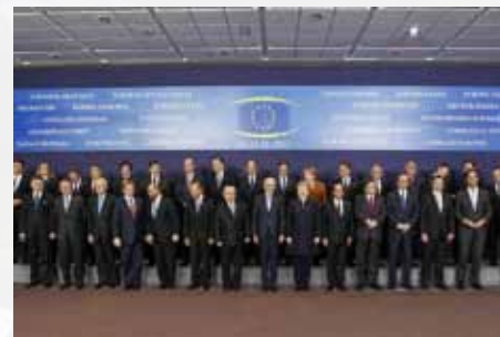
Foto oficial de los jefes de Estado

presidencia tiene lugar el 1 de enero y el 1 de julio de cada año. Una figura creada por el Tratado de Lisboa ha sido el Alto representante de la Unión para asuntos Exteriores y