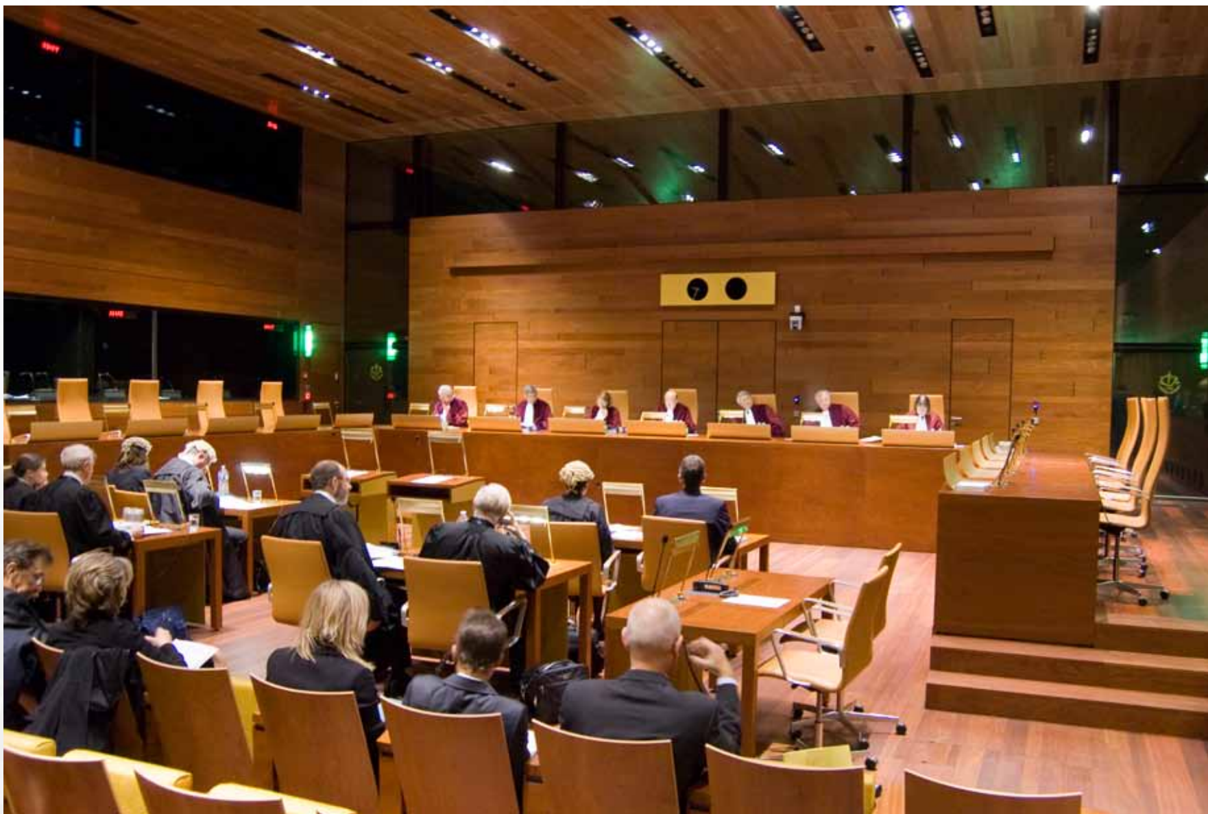
Sala de los 5 jueces del Tribunal de Justicia Europeo