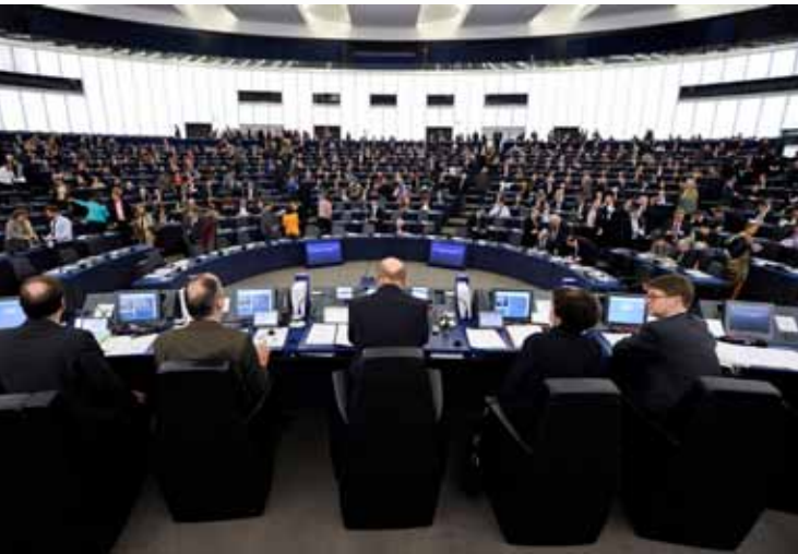
Sesión en el Parlamento Europeo

El Parlamento europeo (PE) es la institución en la que están representados los ciudadanos de los Estados miembros. Desde 1979, el PE es elegido por sufragio universal, es decir por todos los ciudadanos de la Unión Europea con derecho a voto. Anteriormente, los representantes en el PE eran miembros de los Parlamentos nacionales, en cuyo seno eran designados para acudir al PE y su función era puramente consultiva. A partir del Acta Única y el Tratado de Maastricht, el papel del PE se vio reforzado, ejerciendo desde entonces y conjuntamente con el Consejo funciones legislativas , participando en la elaboración de todo acto jurídico de la Unión, en los reglamentos y las directivas. Además, es preceptivo someter a su ratificación los acuerdos internacionales y las nuevas ampliaciones de la Unión Europea. El PE también tiene el derecho de aprobar el marco financiero plurianual,