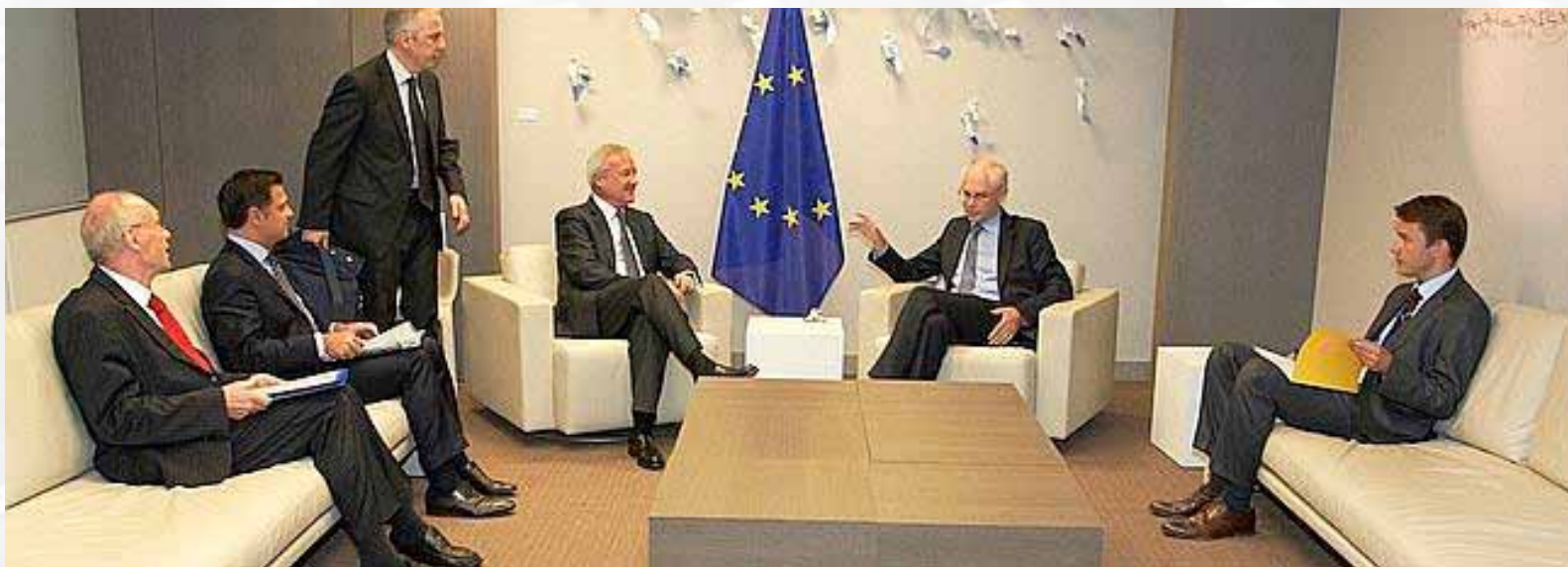
Reunión de los presidentes del Consejo y del Comité de las Regiones

El Banco Europeo de Inversiones es la entidad financiera de la UE. El Banco debe de conceder préstamos y garantías en todos los sectores económicos y en particular para el desarrollo de las regiones más atrasadas, la modernización y la reconversión de sectores económicos o empresas, la creación de empleo, así como para proyectos de interés común de varios Estados miembros. La estructura dirigente del Banco está formada por el Consejo de Gobernadores, el Consejo de Administración y el Comité de Dirección. El Consejo de Gobernadores lo forman