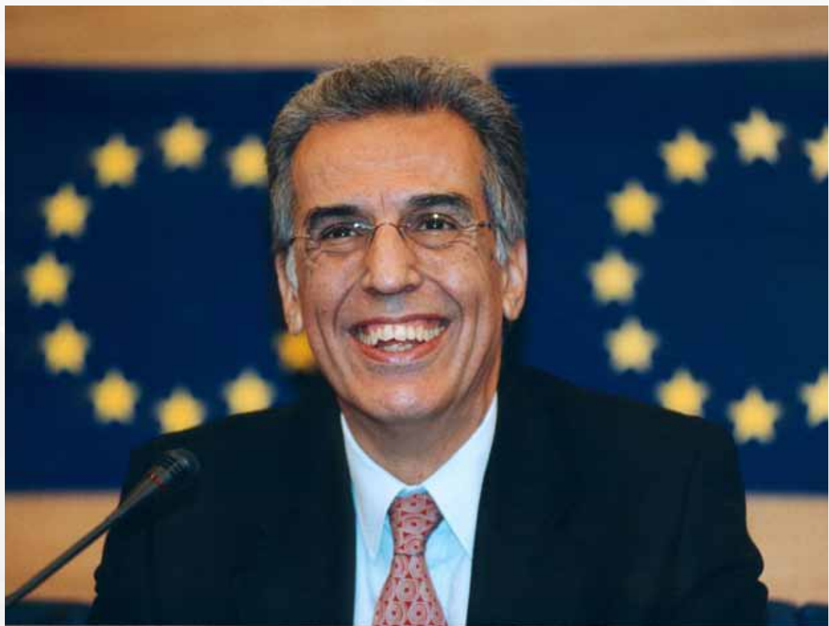
Defensor del pueblo europeo

creado mediante un acto legislativo específico de la UE para realizar una tarea especial (Agencia del control de la pesca, Agencia de medicamentos, Agencia europea de policía, etc.). No obstante, las agencias pueden llamarse con otro título, como centro, observatorio, instituto, etc., y son 31, distribuidas por todos los países de la UE.