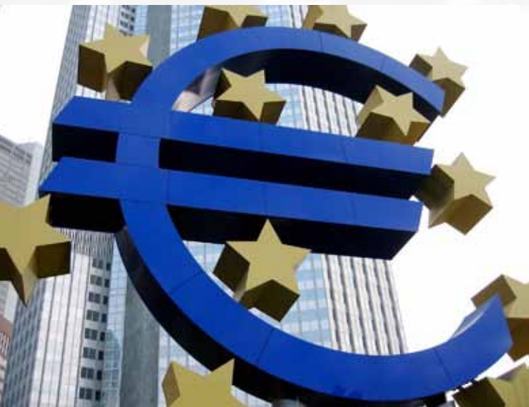
Banco Central Europeo

El Consejo de Gobierno está formado por los presidentes de los bancos nacionales de los diecisiete miembros de la Unión participantes en la zona euro y los miembros del Comité ejecutivo. El Comité ejecutivo está compuesto por un presidente, un vicepresidente y cuatro miembros, designados de común acuerdo por los Estados miembros a recomendación del Consejo y previa consulta al Parlamento Europeo. El BCE se encuentra en Fráncfort.